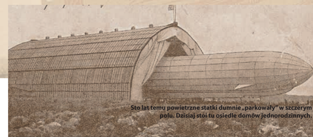
Sto lat temu powietrzne statki dumnie „parkowały” w szczerym polu. Dzisiaj stoi tu osiedle domów jednorodzinnych.

Liegnitz als Luftschiffhafen. Provisor. Kaserne der Luftschiff-Kompagnie und Kantine.