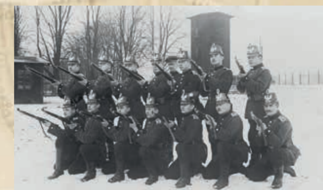
Strażnicy legnickich sterowców - żołnierze 5. Batalionu Sterowców z Grudziądza (karta pocztowa z 1915 r.).