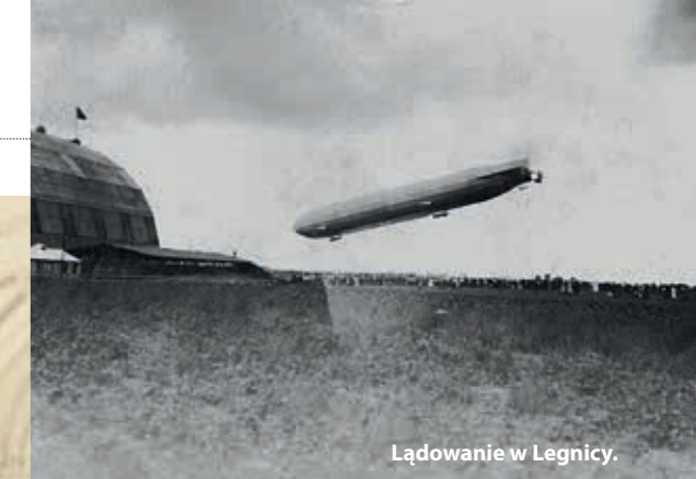
Lądowanie w Legnicy.