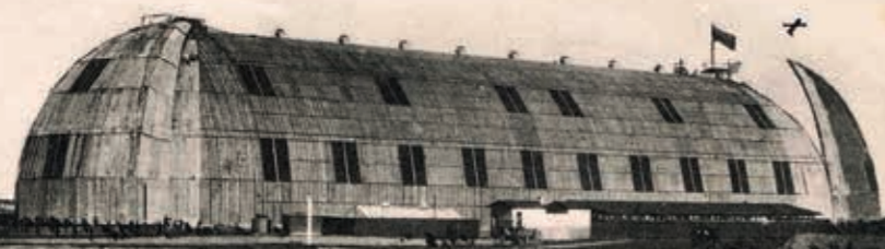
Hala sterowcowa miała 185 m długości (karta pocztowa z 1914 r.).

Pierwszy powietrzny statek-balon wylądował w Liegnitz w 1913 r., wzbudzając niemałą sensację. Po trzech godzinach lotu z Drezna zacumował przy nowo powstałej hali sterowcowej, między dzisiejszymi ulicami Okrężną i Sportowców. Zeppelin szybko stał się jedną z wizytówek przedwojennego miasta, co świetnie ilustrują ówczesne karty pocztowe.