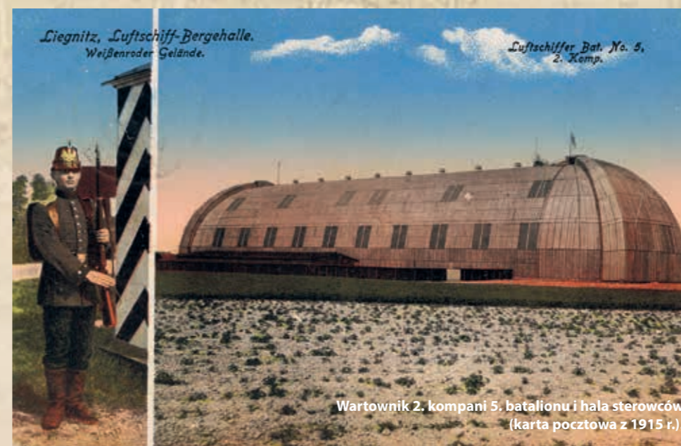
Wartownik 2. kompanii 5. batalionu i hala sterowców (karta pocztowa z 1915 r.).