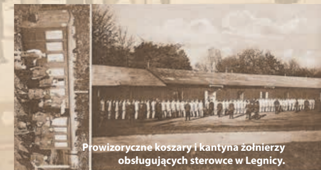
Provizoryczne koszary i kantyna żołnierzy obsługujących sterowce w Legnicy.

Liegnitz als Luftschiffhafen. Provisor. Kaserne der Luftschiff-Kompagnie und Kantine.