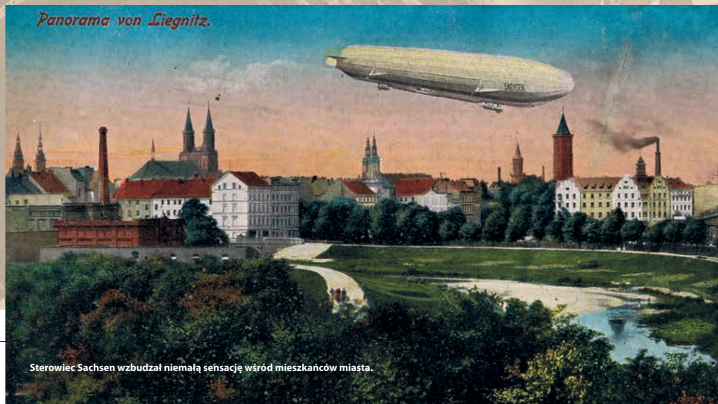
Sterowiec Sachsen wzbudzał niemałą sensację wśród mieszkańców miasta.