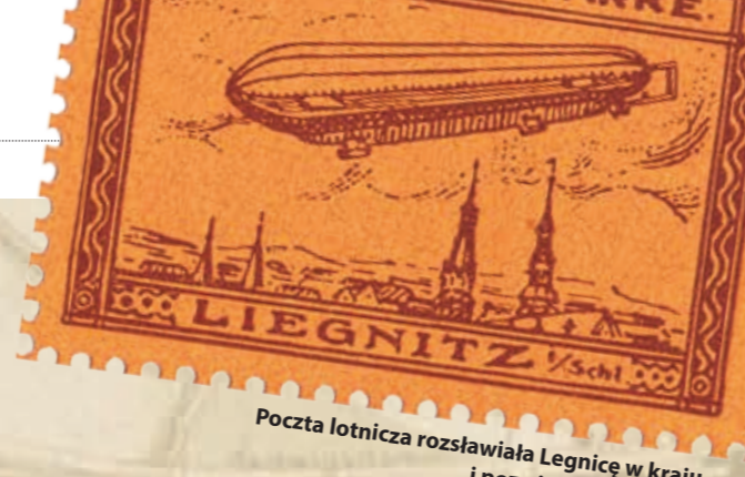
Poczta lotnicza rozslawiała Legnicę w kraju i poza jego granicami.

Sterowce, przypominające kształtem gigantyczny ogórek, wykorzystywane były do celów cywilnych i wojskowych. Na pokład kolosa wejść mogło kilkudziesięciu pasażerów. Mimo ogromnego tonażu, z wielką gracją wznosił się on w powietrzu, przelatując setki kilometrów między miastami, a nawet tysiące między kontynentami. Najsłynniejszy i największy sterowiec pasażerski, znany jako Hindenburg (model LZ129), zapewniał 50 osobom (ok. 60 członków załogi) w luksusowych warunkach przelot nad Atlantykiem z prędkością 135 km na godzinę.