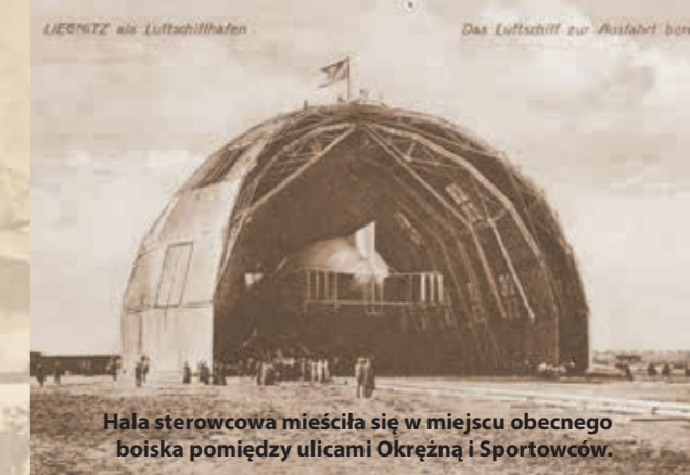
Hala sterowcowa mieściła się w miejscu obecnego boiska pomiędzy ulicami Okrężną i Sportowców.